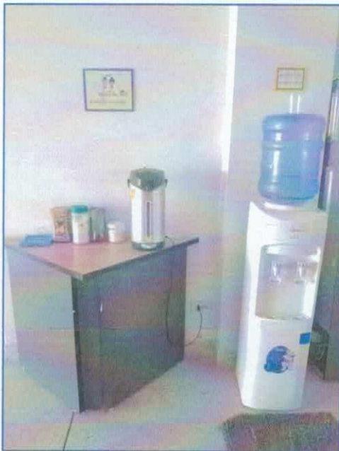
พื้นที่บริการน้ำดื่ม น้ำดื่ม