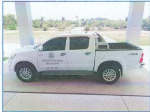
วัสดุอุปกรณ์ รถยนต์ อยู่ในสภาพดี