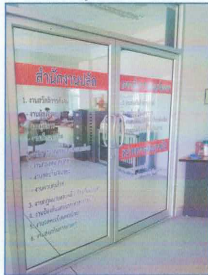
สภาพประตู หน้าต่าง ชั้นบันได