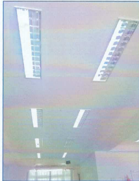
อุปกรณ์หลอดไฟฟ้าตามที่ต่างๆ