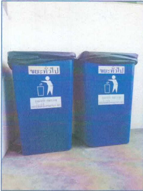
มีที่รองรับมูลฝอยเพียงพอ มีฝาปิดมิดชิด